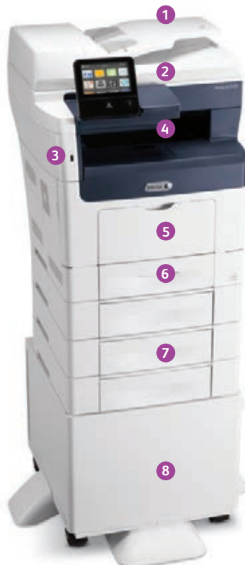
Xerox® VersaLink® B405 Multifunktionsdrucker Drucken. Kopieren. Scannen. Fax. E-Mail.